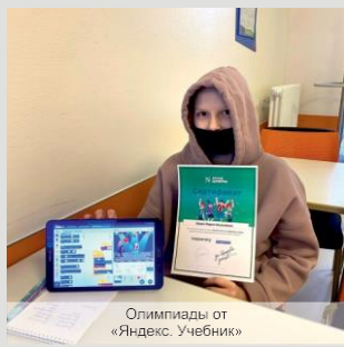
Олимпиады от «Яндекс. Учебник»