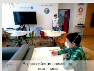
Всероссийская олимпиада школьников

Еще одним механизмом поддержки высоких образовательных результатов обучающихся в Госпитальной школе «УчимЗнаем» является возможность участия каждого ребенка в интеллектуальных мероприятиях – олимпиадах, конкурсах, викторинах, турнирах. Очень важно, когда дети, находящиеся на длительном лечении, участвуют в соревнованиях наравне с другими школьниками, получают статус победителя или призера школьного, регионального или всероссийского уровня.