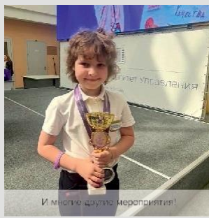
И место для мероприятия!