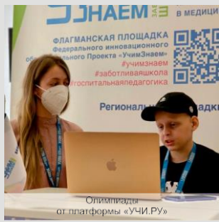
Олимпиады от платформы «УЧИ.РУ»