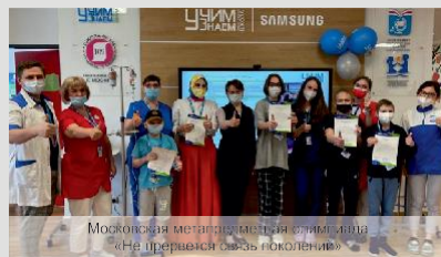
Московская metropolitana олимпиада «Не прерывай связь поколений»